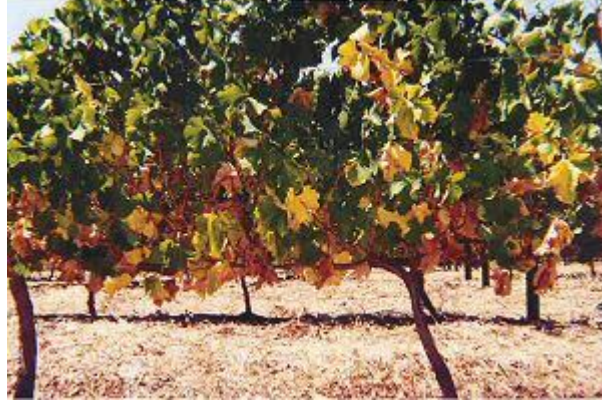
Resim 1. Bağda susuzluk belirtisi

Asmaya zamanında ve gereken miktarda su verilerek sulama yapılması ne kadar faydalı ise gereğinden fazla ve aşırı sulama da aynı oranda zararlıdır.