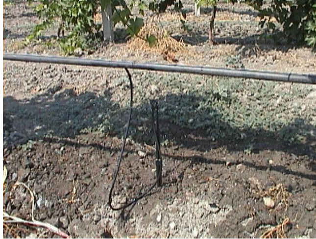
Resim 4. Mini sprink sulama yöntemi

Ağaç altı mikro yağmurlama (mini sprink) sisteminin uygulanması için yüksek terbiye sistemlerinin kullanılması gerekir.