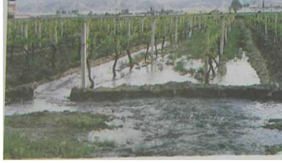
Resim 2. Karık sulama yntemi

Salma sulama ynteminde su uygulama randımanı ok dşktr. Genellikle, aşıırı su kullanımı sz konusudur. Derine sızan su miktarı fazla olur. Dolayısıyla, taban suyunun ykselmesi ya da taban suyu oluřturulması, drenaj probleminin ortaya ıkması ve arazinin tuzlulařması gibi sorunlarla ok sık karřılařılır.